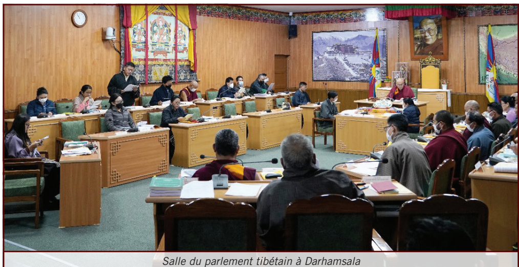
Salle du parlement tibétain à Darhamsala